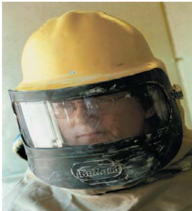
شکل ۶ تصویر کلاه‌های که ناحیه سر و گردن را می پوشاند

ث تعمیر، بازرسی، تمیز کردن و نگهداری وسیله حفاظت تنفسی.